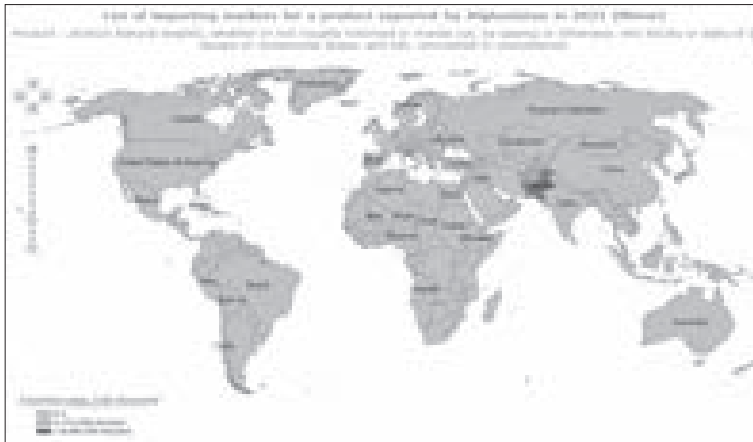
شکل ۱۰: توزیع کشورهای واردکننده تالک پودرنشده افغانستان در سال ۲۰۲۰