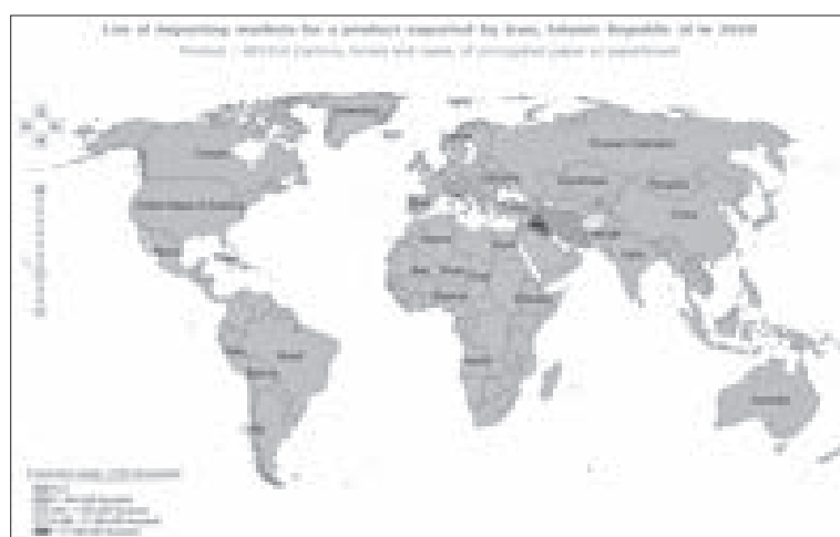
شکل ۲۴: توزیع کشورهای واردکننده کارتین یا جعبه از ایران در سال ۲۰۲۰