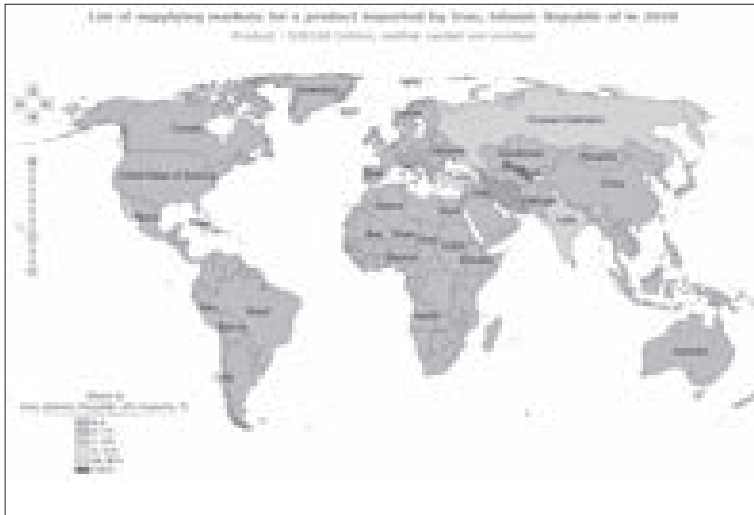
شکل ۵: توزیع کشورهای صادرکننده پنبه خام به ایران در سال ۲۰۲۰