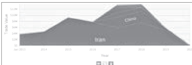
نمودار ۲۹: روند واردات پلی وینیل کلراید افغانستان