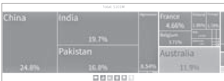
شکل ۱۳: سهم کشورها از صادرات تالک خام جهان در سال ۲۰۲۰

۸. نمودارهای زیر بزرگ‌ترین صادرکنندگان تالک پودر شده را نشان می‌دهد. نمودار نشان دهنده افزایش تولید کشورها در بخش تالک پودر شده است.