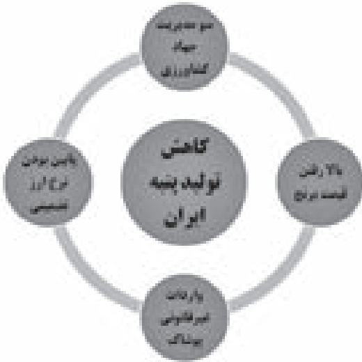
شکل ۸: علل کاهش تولید پنبه ایران