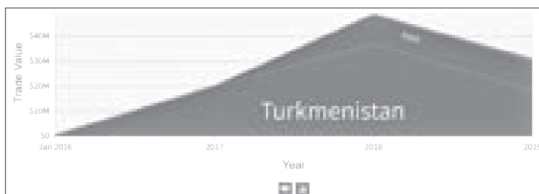
نمودار ۲۵: روند واردات روغن‌های نفتی افغانستان