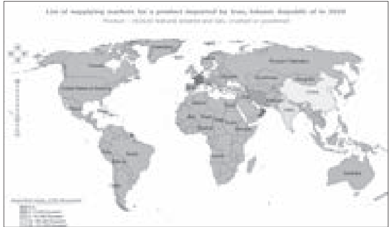
شکل ۱۱: توزیع کشورهای صادرکننده تالک پودرنشده به ایران در سال ۲۰۲۰