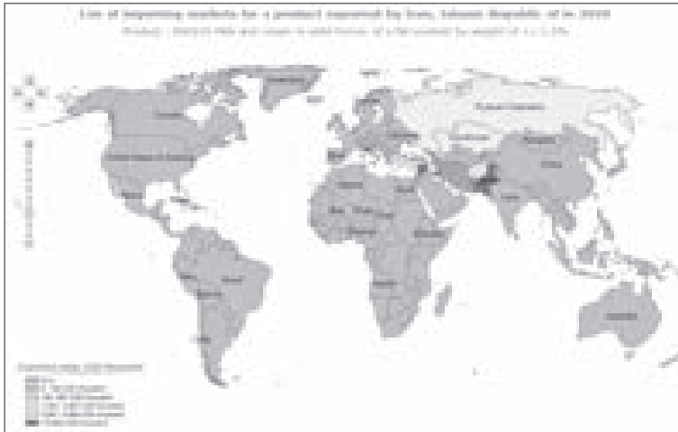
شکل ۲۲: توزیع کشورهای واردکننده پودر شیر و خامه از ایران در سال ۲۰۲۰