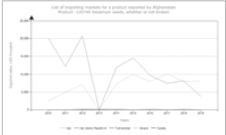
نمودار ۲۰: روند صادرات کنجد افغانستان