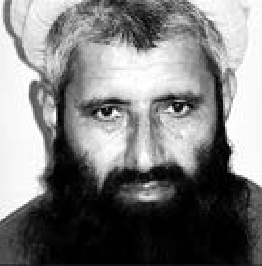
عبدالرحیم مسلم دوست