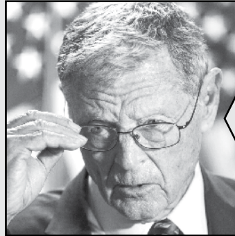
جلسه کمیته نظامی سنا ۲۸ سپتامبر ۲۰۲۱

ژنرال میلر که در زمان فرماندهی نیروهای ایالات متحده در افغانستان به زنجیره فرماندهی خود توصیه کرده که حدود ۲۵۰۰ سرباز را در کشور نگه دارد، او هشدار داده که در غیراین صورت ممکن است طالبان کنترل را به دست گیرند. ژنرال مک کنزی! شما نیز گفتید نگرانی من از توانایی ارتش افغانستان در حفظ موقعیتی است که سال‌ها برای حفظ آن حمایت‌های زیادی می‌گرفتند. در طول بهار شاهد بودیم که بسیاری از شهرها بدون شلیک گلوله به سرعت به دست طالبان سقوط کردند.